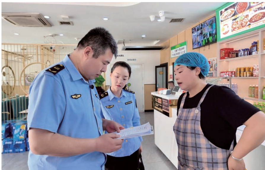
▲ 贺兰县市场监管局工作人员检查食品安全情况。

治中发现的监管薄弱环节，派驻纪检监察组靠前监督，联合县教体局、市场监管局，主动邀请“两代表一委员”开展集中检查，通过新媒体直播贺兰一中、贺兰一幼及周边托管机构检查全过程，倒逼主体责任落实。直播曝光后，学校食堂送餐质量有效提升，就餐人数明显增加，“校园餐”领域投诉举报量