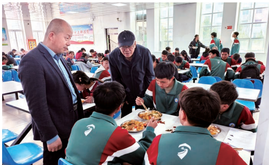
▲泾源县纪委监委第一派驻纪检组调研学生对食堂饭菜满意度情况。

攻坚信访突出难题。排查起底民生领域信访事项48件，严格实行“一案一领导、一专班、一方案”工作机制，确保事事有落实、件件有回音。坚持开门搞整治，对群众反映