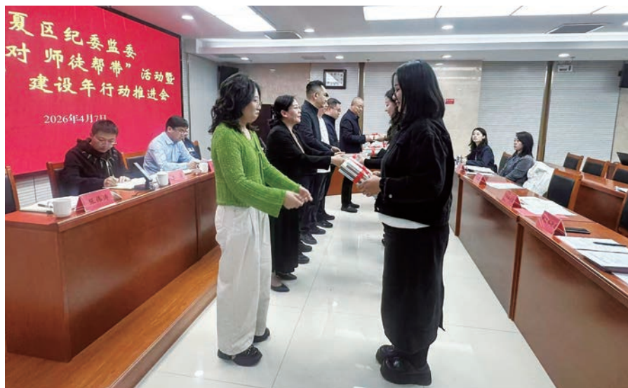
▲ 西夏区纪委监委举行“青蓝结对”“师徒帮带”赠书仪式，19名导师为25名帮带对象赠送纪检监察业务书籍。

铸魂育人固根本。把政治理论培养作为“帮带第一课”，举办“西夏区纪检监察系统业务能力提升培训班”，6位导师围绕纪法条文适用、办案流程规范等内容开展专题授课；以廉政警示教育暨纪法教育月为契机，通过听廉政党课、参观廉政教育基地等方式为帮带对象