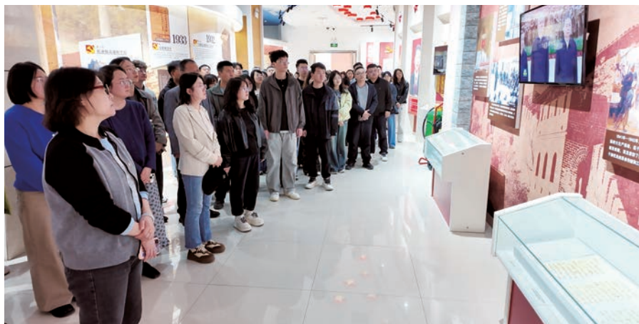
▲ 利通区组织新提拔、新重用、新录用“三新”党员干部和纪检监察干部开展现场警示教育。