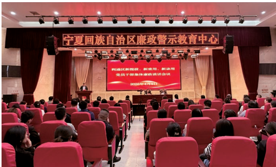
▲ 利通区组织新提拔、新重用、新录用“三新”党员干部和纪检监察干部开展集体廉政谈话会议。

利通区纪委监委紧盯年轻干部这一重点群体，综合运用“入职第一课”、廉洁文化“润心铸魂”教育、纪法知识培训、派驻谈心谈话等多种