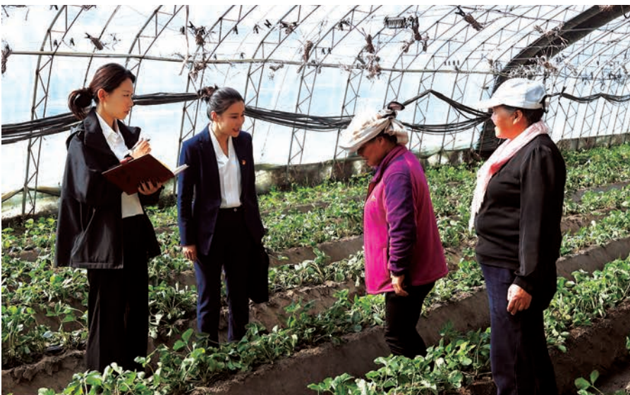
▲石嘴山市纪委监委运用“纪审”联动机制，实地走访乡村振兴项目建设情况，扎实推进乡村振兴资金监督专项整治。

压实责任聚力攻坚办案。完善市纪委监委班子成员包抓机制，对集中整治重点（薄弱）部门及问题突出的乡镇（街道）实行一对一包抓，以领导包案、