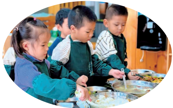
▲为解决“校园餐”这一关乎学生健康成长的民生大事，平罗县纪委监委扎实推进校园餐管理专项整治行动，一系列实招硬招让校园餐桌既安全又暖心。

手、以整改整治为保障，通过精准监督推动系统施治，让群众在集中整治中看到变化、得到实惠。