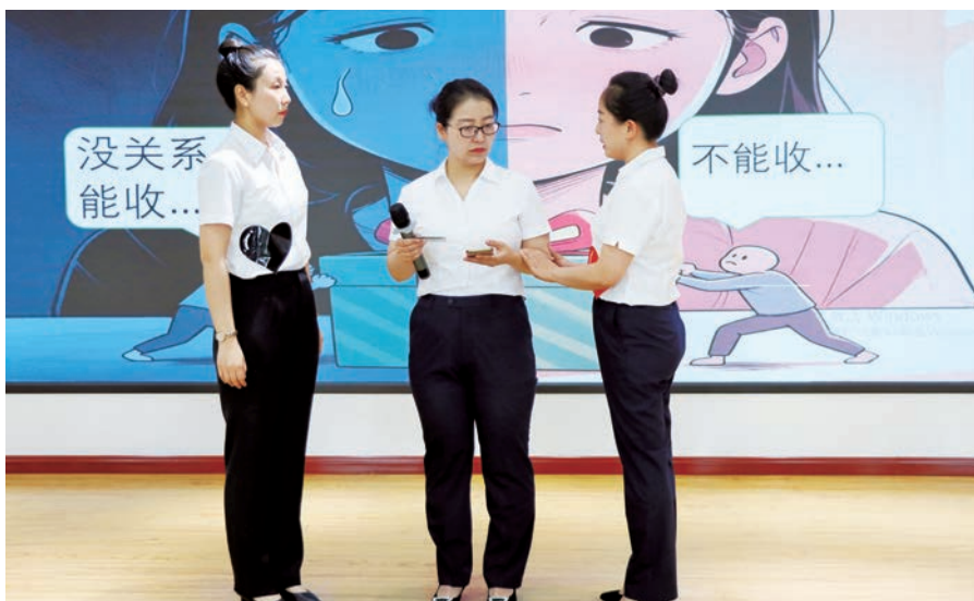
▲ 青铜峡市纪委监委举办“古峡青年说清廉”宣讲比赛。

风尚融入基层生活。将廉洁文化建设与基层治理、乡风文明建设相结合，推动廉洁理念融入村规民约、家风家训，引导群众自觉崇廉向善，持续夯实廉洁社会根基，让清风正气充盈黄河古峡，为全市经济社会高质量发展提供坚强纪律保障。◆