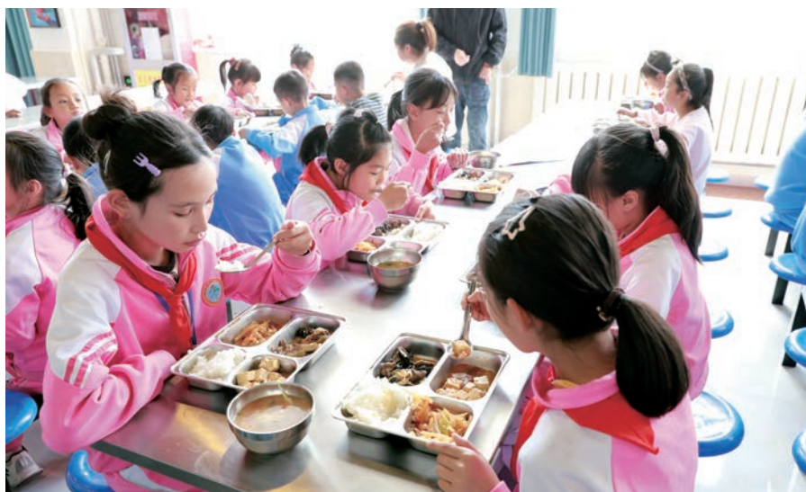
▲ 隆德县统筹拨付专项资金，统一采购、免费配备餐盘、餐勺及汤碗，保障学生用餐卫生安全。

财政兜底纾困。针对食堂用工薪酬保障不足、校园餐饮运营经费紧张等问题，把食堂从业人员薪资全额纳入县级财政预算，今年以来共拨付368.74万元，保障