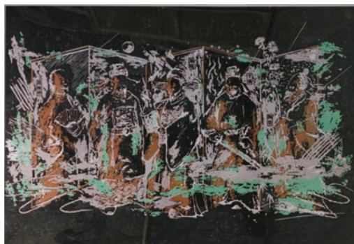
木刻版画《廉贞北斗五星宿》