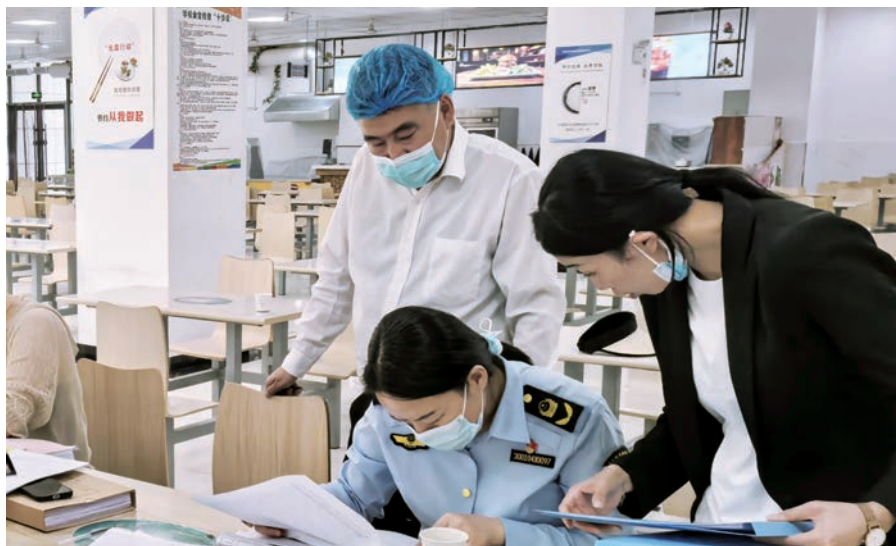
▲ 灵武市纪委监委联合教体局、市场监管局等单位在灵武市职业技术学校食堂开展监督检查。

延伸服务“暖心托管”。立足群众急难愁盼，积极探索城区学校午间托管服务模式，有效解决家长午间接送难、学生就餐难等实际问题。试点推行“集中配送+保温箱转运”服务模式，严格管控食材储存、加工、运输全链条流程，保障4所学校540余名午间托管学生吃上热乎饭、放心餐。