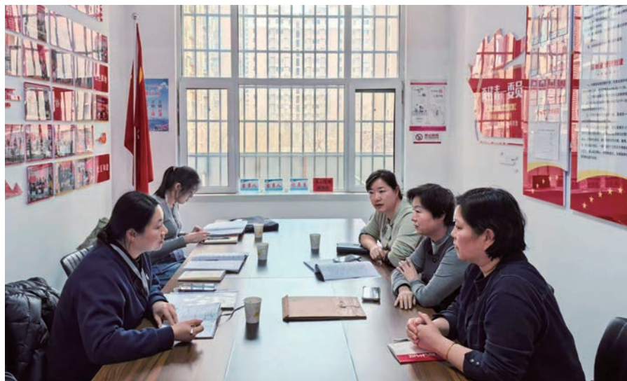
▲ 大武口区纪委监委工作人员深入基层一线督导群众身边不正之风和腐败问题集中整治工作。

用好警示“清醒剂”。坚持常教育、提觉悟、树敬畏，做实案件查办“后半篇文章”。组织大武口区级领导干部前往石嘴山市