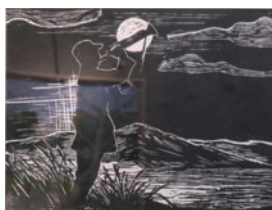
木刻版画《西行回响》